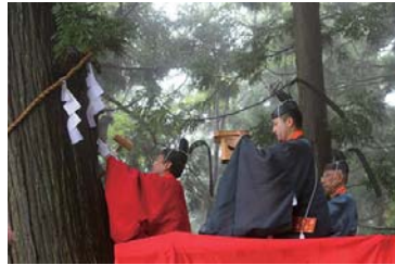
式年薙鎌打ち神事(具指定無形民俗文化財)

日本三大奇祭のひとつとされる諏訪大社の御柱祭。 采年(とと)に迫った御柱祭の前に、小谷村中谷の大宮諏訪神社では、 7年に1度の「式年薙鎌打ち神事」が行われます。 今回のマップでは、北アルプス地域の諏訪信仰と 諏訪明神を主祭神とする神社を紹介します。