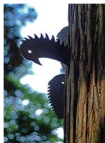
御神木に打ち付けられた薙鎌

旧小谷総社である中谷の大宮諏訪神社に古くから伝わる神事。 諏訪の御柱祭の前年に、信越の国境にあるご神木に薙鎌を打ち付けるもので、 神事のために諏訪大社から官司が来社して斎行します。 今年は8月29日(日)に奉告祭、30日(月)に小倉明神にて薙鎌打ち神事を予定していますが、 コロナウィルス感染拡大防止のため一般の方は入場不可、関係者のみで行います。